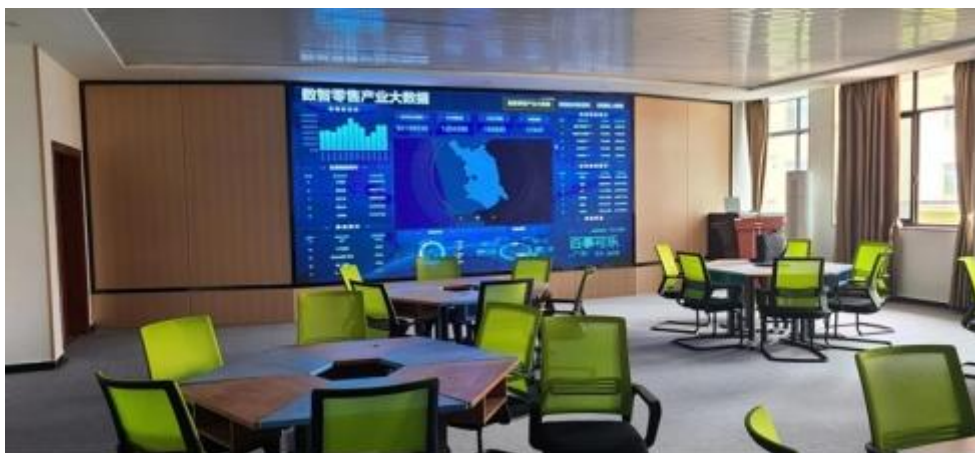
图 智慧 售 中心