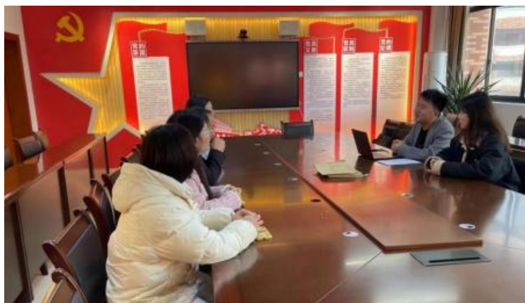
图 企开展学术 交 会