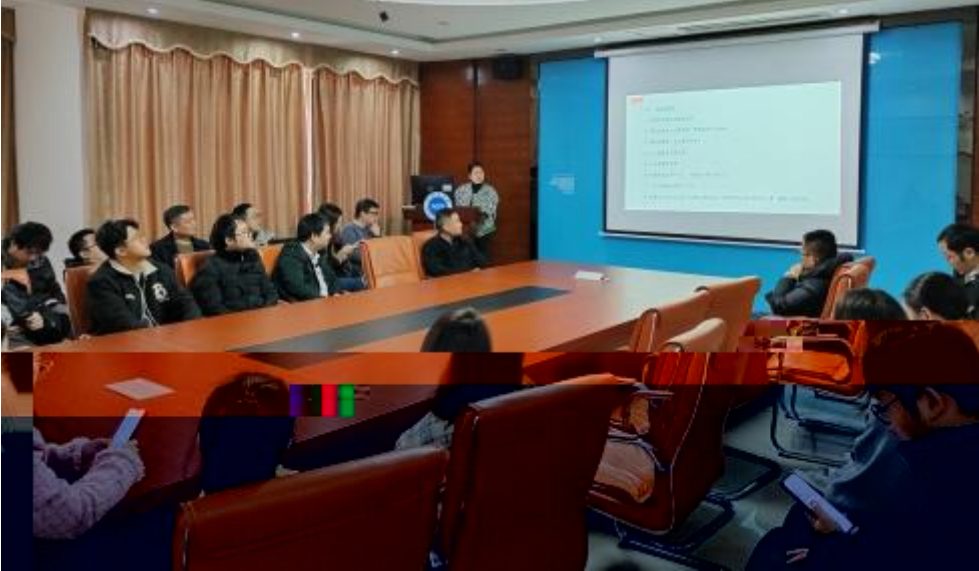
图 员工专业技 培