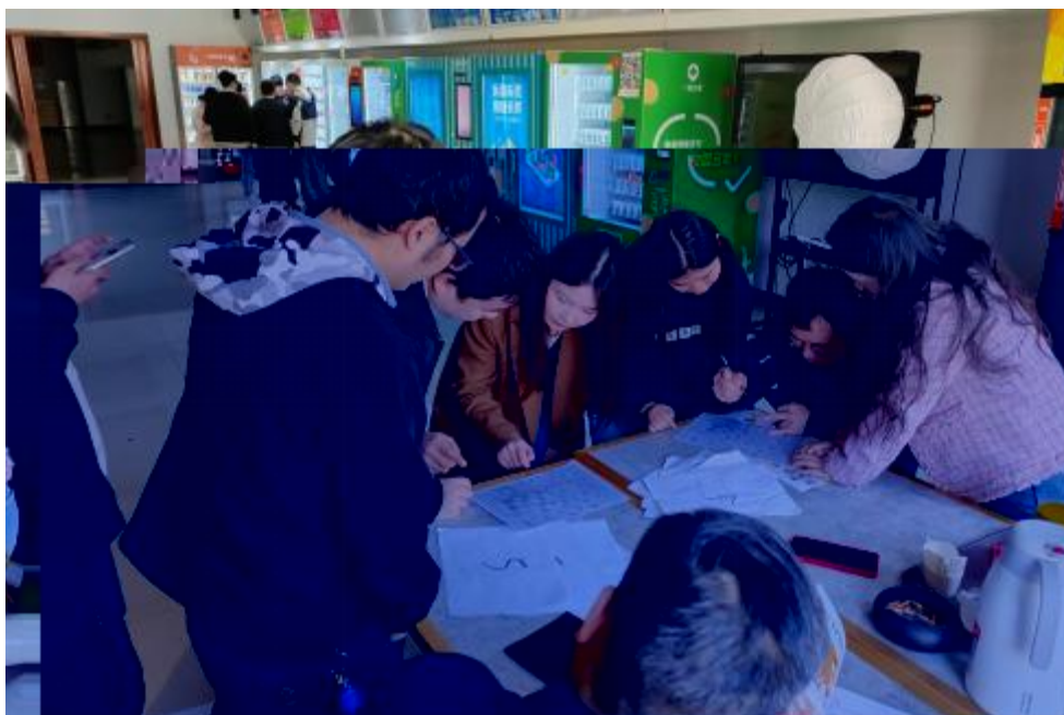
图 卓 团 建 共