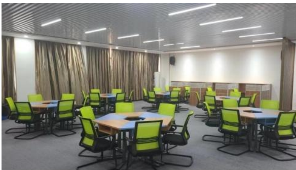
图 智慧 售 中心